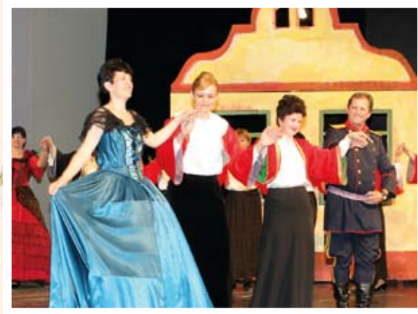
Фолклор: грађанска игра